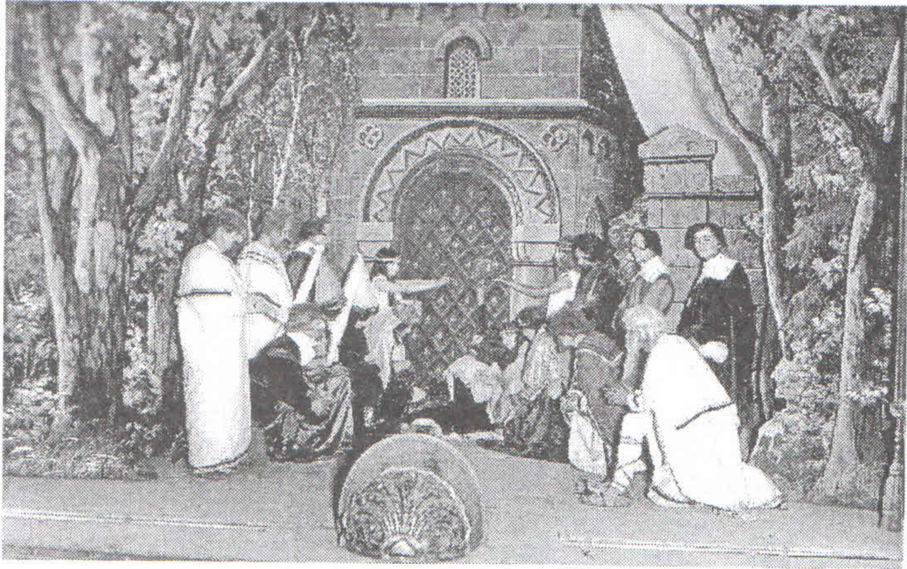
/ Divadelní představení "Svatý kníže Václav", 28. září 1929/

obvodového cvičení a v roce 1936, kdy se slavilo 25 let trvání Jednoty čs. Orla v Ústí nad Orlicí, se zde konala slavnostní tělocvičná akademie a byl posvěcen nový prapor. V roce 1948 byl Orel sloučen s ostatními tělovýchovnými organizacemi a jeho činnost i v Ústí nad Orlicí na dalších 40 let samostatně přestává existovat. V roce 1952 přešlo vlastnictví usnesením valné hromady Svatojosefské jednoty katolických jinochů a mužů na Českou katolickou charitu, která svoji polovinu prodává v roce 1957 národnímu podniku UTEX. Poslední přestavba proběhla v 70. letech na dnešní Malou scénu. Po roce 1989 byl při pokusech Orla i Svatojosefské jednoty o navrácení Katolického domu uváděn argument, že byl majetek dobrovolně a podle práva odprodán, tudíž není co vracet.