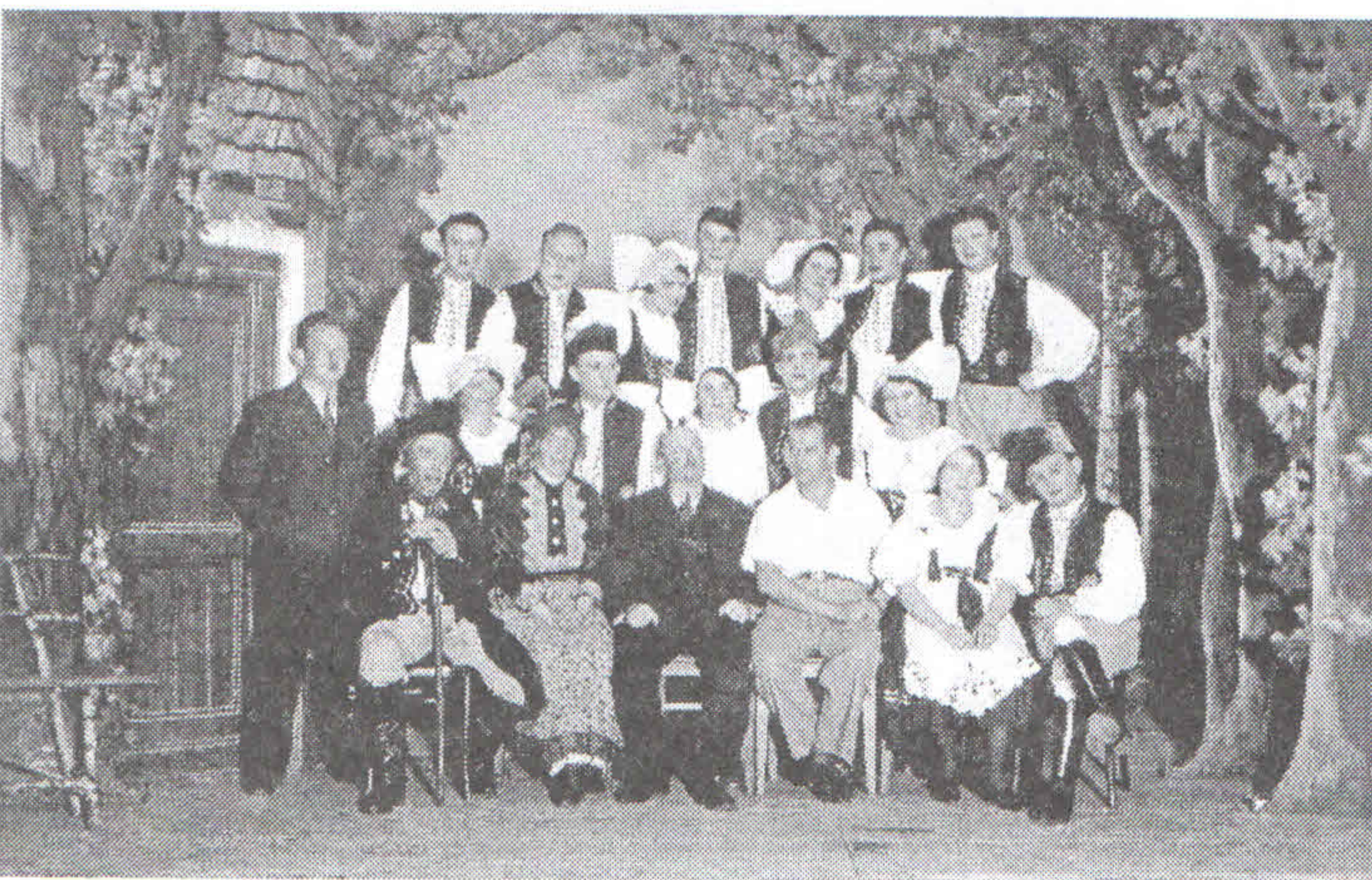
/ Fidlovačka, 1927/