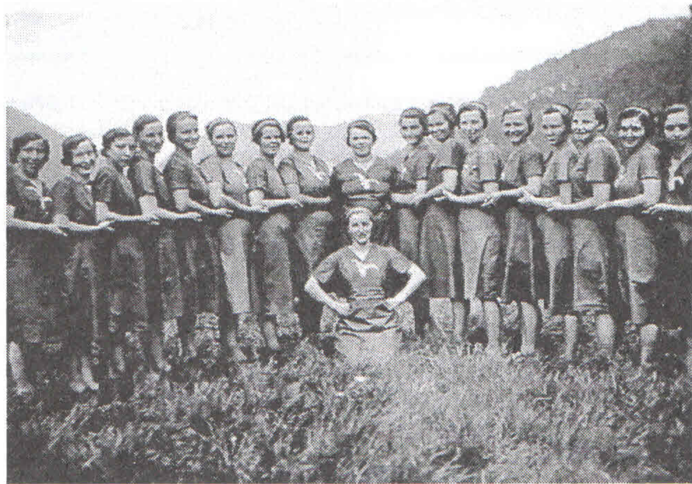
/Ženy na cvičení v Klopotech, 1939/