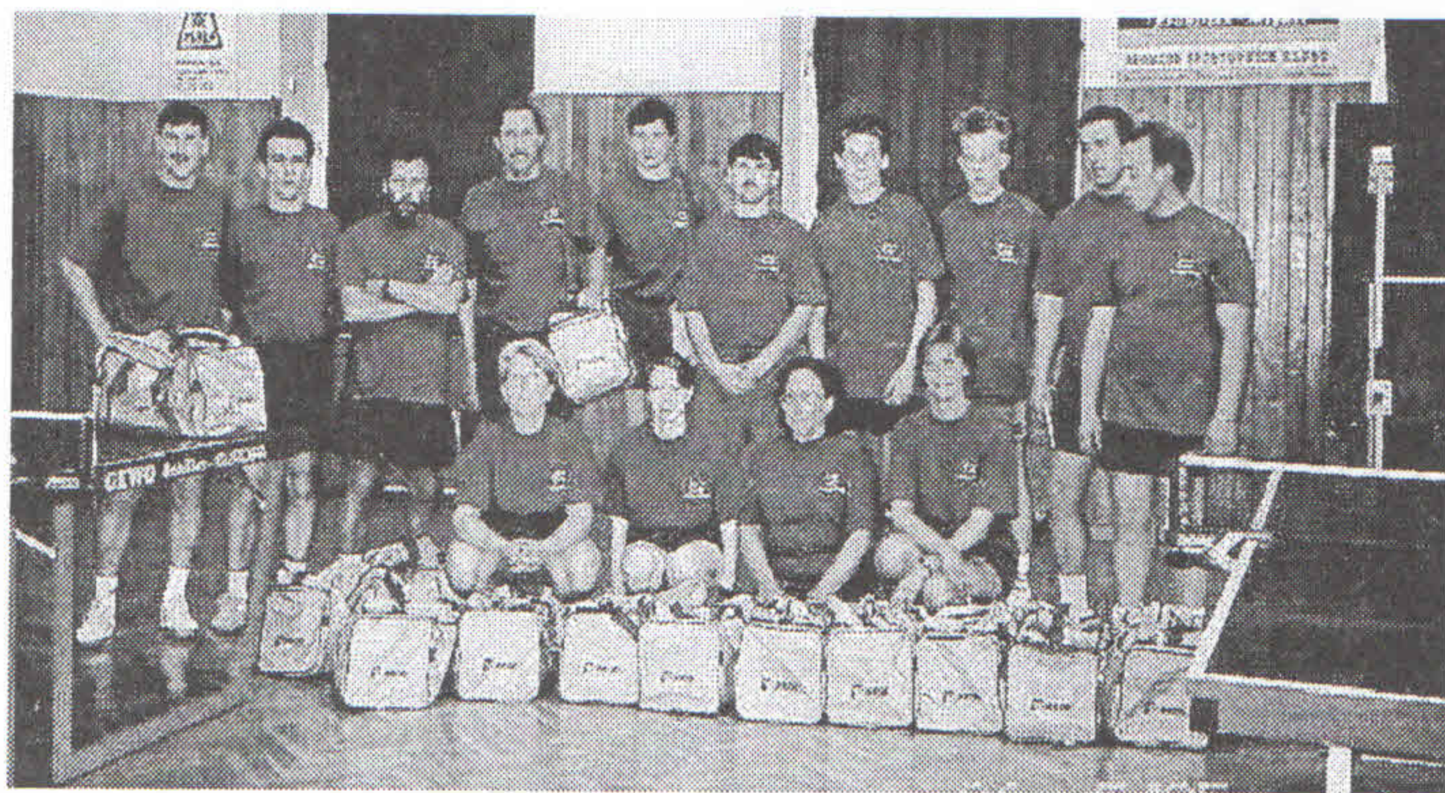
/ Stolní tenisté z Belgie v herně na Kopečku před utkáním s TTC Ústí a členy Orla,